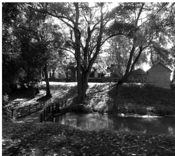
Dubelės upelio pakrantėje kukliečiai įrengė parką, kurį išnaudoja susiejimams. Ypač čia patogų švęsti Jonines, mat jaunosios kurkietės vainikėlius iš karto gali plukdyti upeliu.